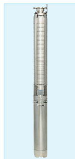
深井戸用水中ポンプ

世界各地の水事情に合わせたものづくりを進めてきたエバラは、ブラジルで昭和50年から深井戸ポンプの製造・販売を開始し、農業・工業用として幅広く利用されてきました。新興国のみならず、ヨーロッパをはじめ世界のあらゆる地域の井戸で深井戸用水中ポンプは必要とされています。