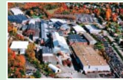
Elliott Company (米国)